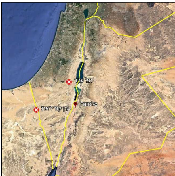
איור 108: עין קודיראת - המקום המזוהה כיום כקדש

אפשר היה למלא עשרות כרכים בתיאור החיפוש אחר קדש, וכיצד לבסוף נקבע מיקומה ב-'עין קודיראת'.