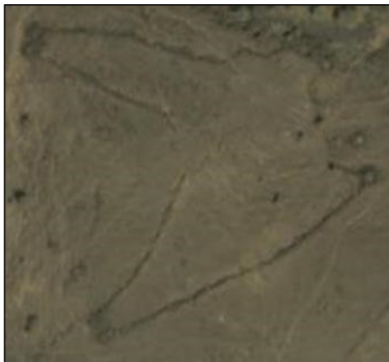
איור 222: עץ משפחה מעט יותר מורכב