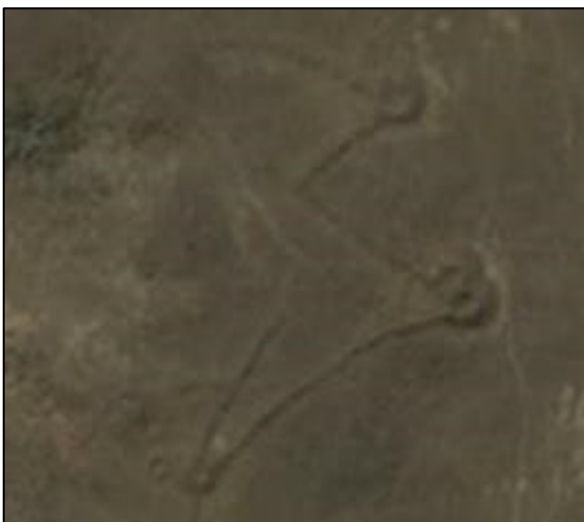
איור 221: עץ משפחה פשוט ביותר

העץ שבאיור הימני מעט יותר מורכב. שים לב למספר המעגלים שבו.